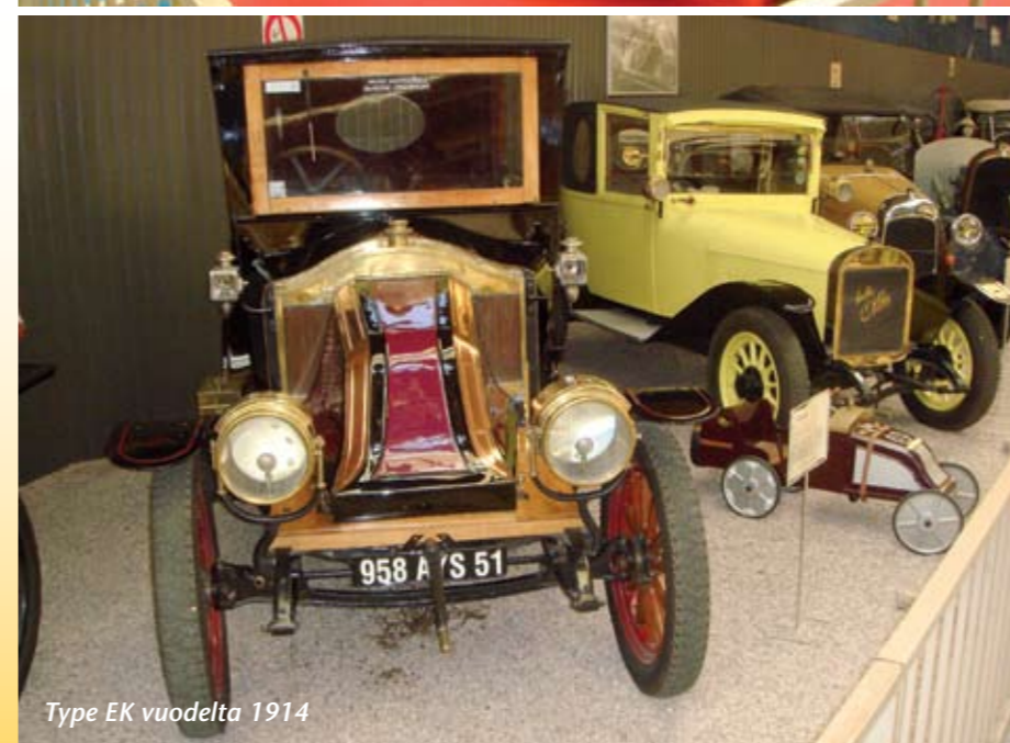
Type EK vuodelta 1914