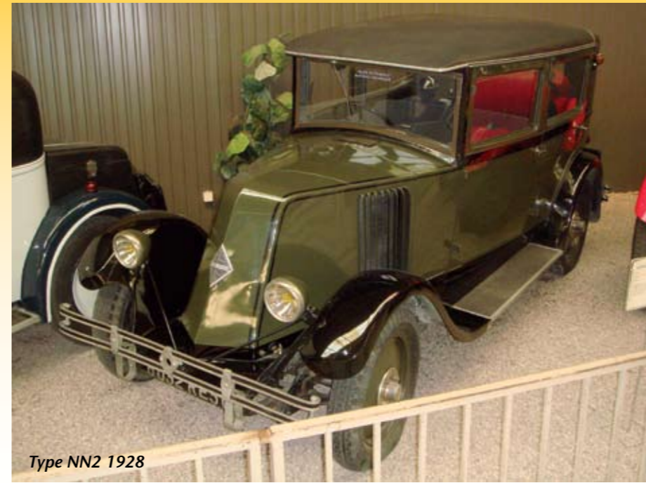
Type NN2 1928