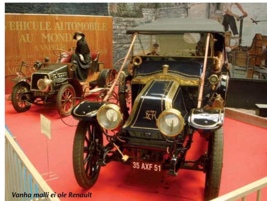
Vanha malli ei ole Renault