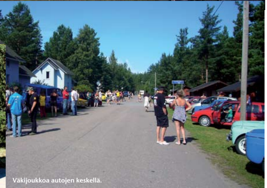
Väkijoukkoa autojen keskellä.