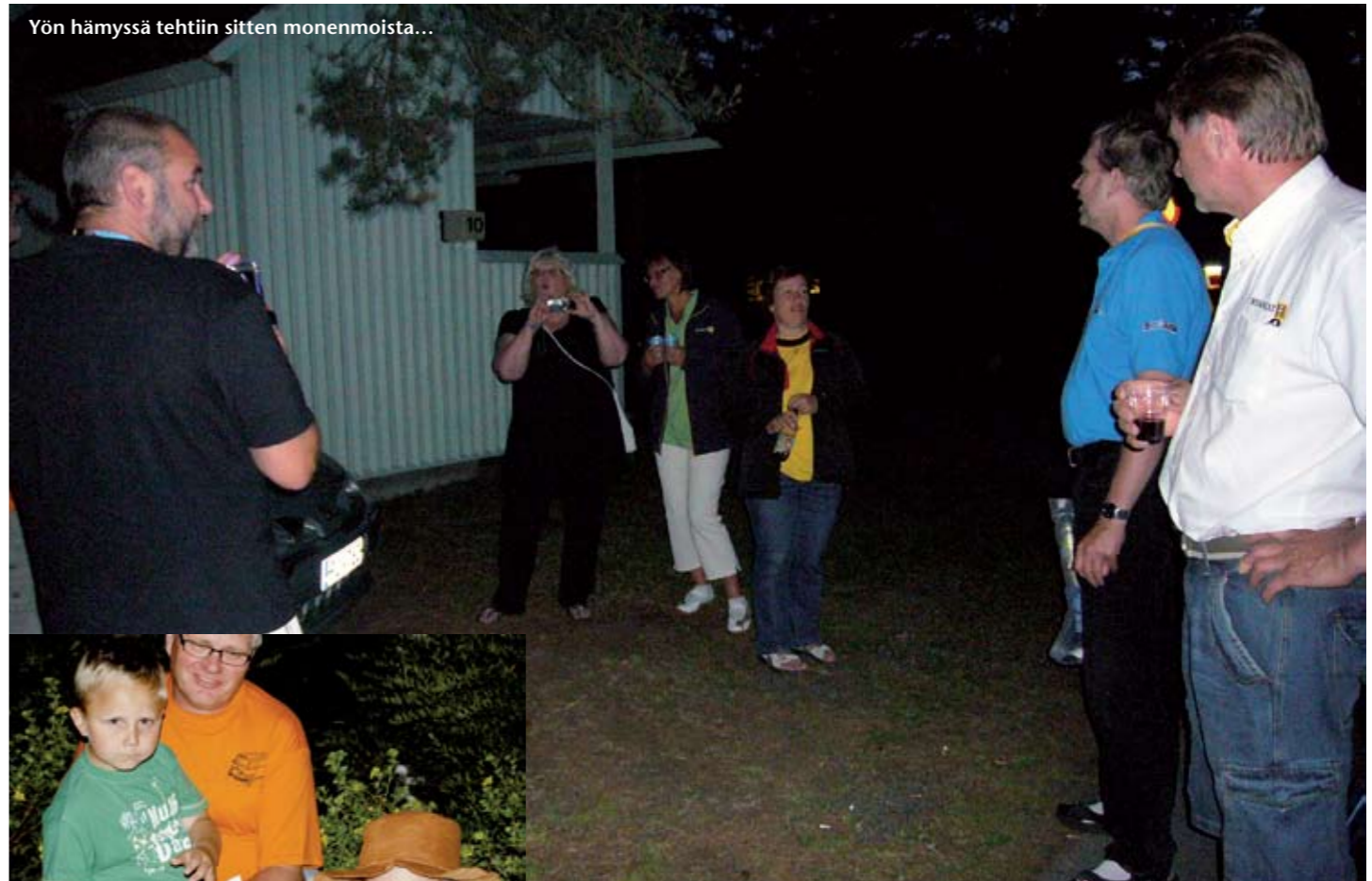
Yön hämyssä tehtiin sitten monenmoista...