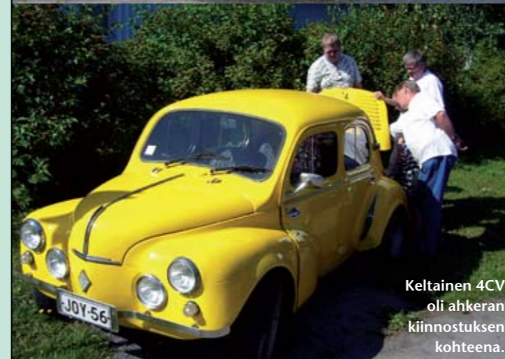
Keltainen 4CV oli ahkeran kiinnostuksen kohteena.