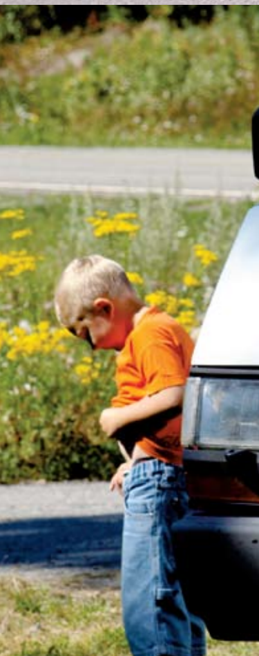
Hätä pääsi yllättämään.