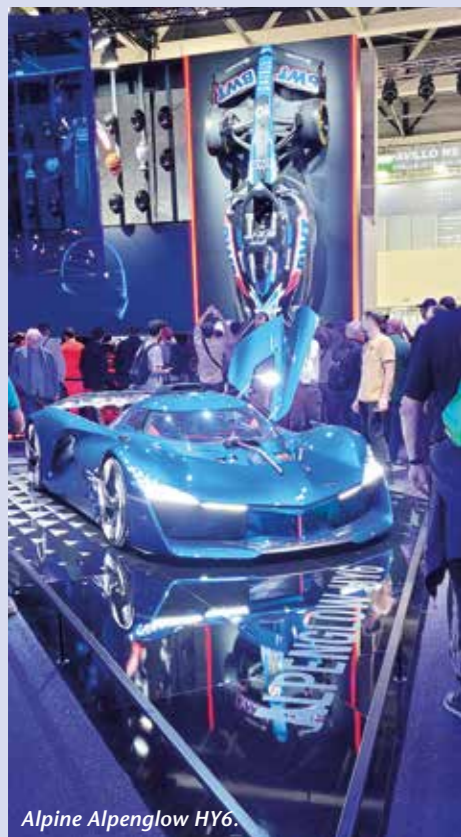
Alpine Alpenglow HY6.