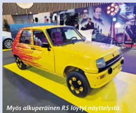
Myös alkuperäinen RS löytyi näyttelystä.