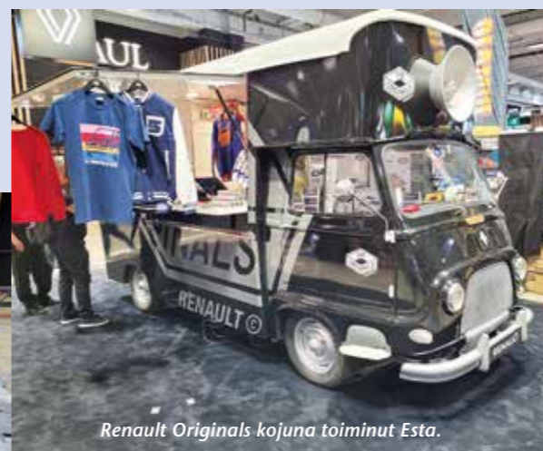
Renault Originals kojuna toiminut Esta.