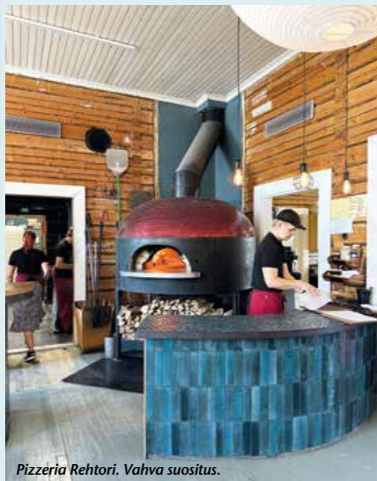
Pizzeria Rehtori. Vahva suositus.