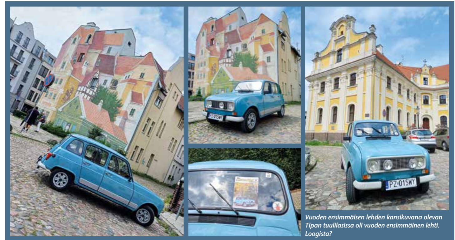
Vuoden ensimmäisen lehden kansikuvana olevan Tipan tuulilississa oli vuoden ensimmäinen lehti. Loogista?

Lisätiedot ja tilaukset info@vrumvrum.si .