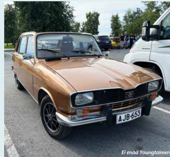
Ei enää Youngtaimeri.