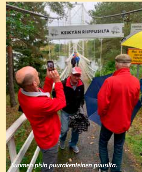
Suomen pisin puurakenteinen puusilta.