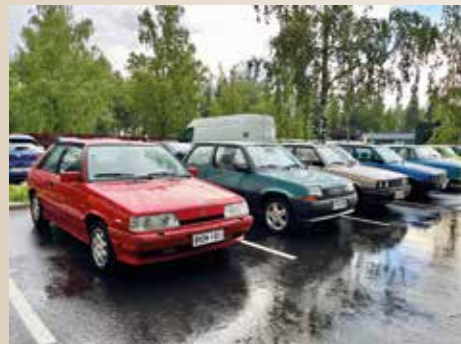
Kiva rivi Youngtimereita.