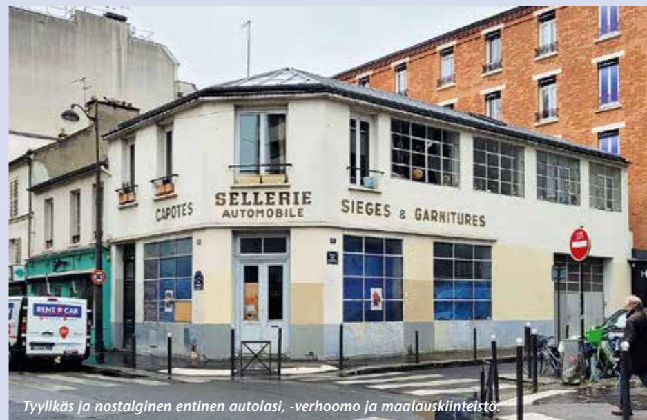
Tyylikäs ja nostalginen entinen autolasi, -verhoamo ja maalauskiinteistö.