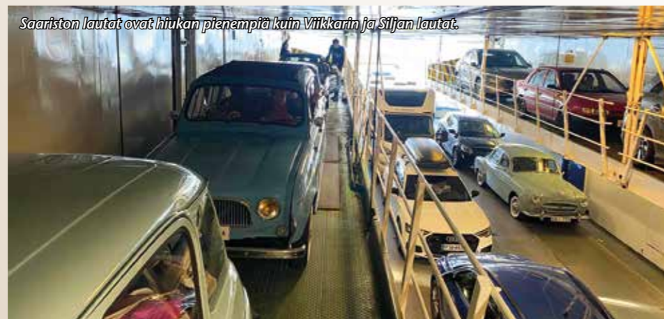
Saariston lautat ovat hiukan pienempiä kuin Viikarin ja Siljan lautat.