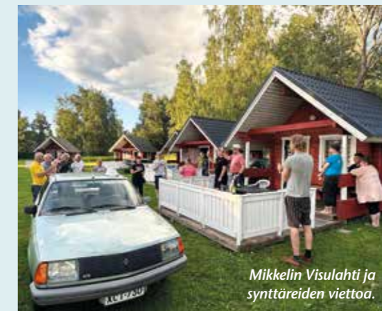
Mikkelin Visulahti ja synttäreiden viettoa.