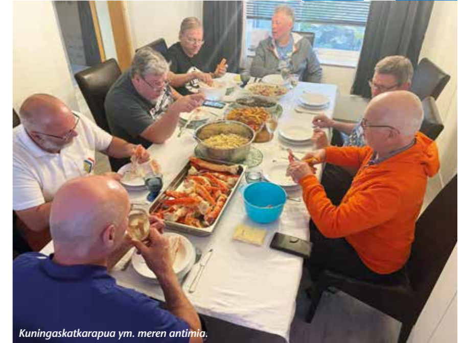
Kuningaskatkarapua ym. meren antimia.

Varanginvuono oli nyt meidän vasemmalla kädellä