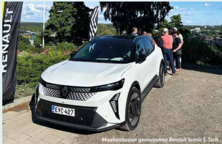
Maahantuojan sponsorioima Renault Scenic E-Tech.

Ensimmäinen tapaaminen oli Turussa, lentokentän kupeessa Caravelle-lentokoneprojektiin tutustuessa. Tästä ensimmäisestä tapahtumasta en sen enempää osaa kertoa, sillä kaverini oli osannut valita hääpäivänsä juuri samalle päivälle, siitä kuva todisteena ja syy minkä takia kuljetin koko viikon pukua mukana kiertueella. Väri oli sattumalta sopiva.