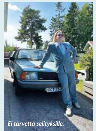
Ei tarvetta selityksille.