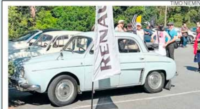
Renault-kerhon 40-vuotisjuhlakiertueella Jyväskylässä nähtiin ranskalaisia autoja 1960-luvulta tämän vuoden uutuusmalliin.