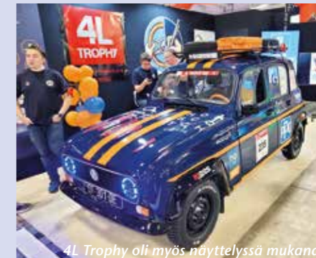
4L Trophy oli myös näyttelyssä mukana.