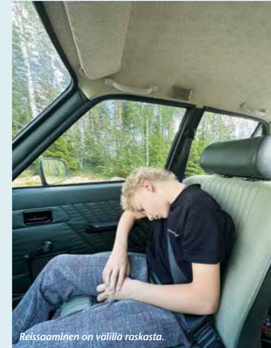
Reissaaminen on välillä raskasta.