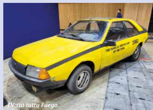
TV:stä tuttu Fuego.