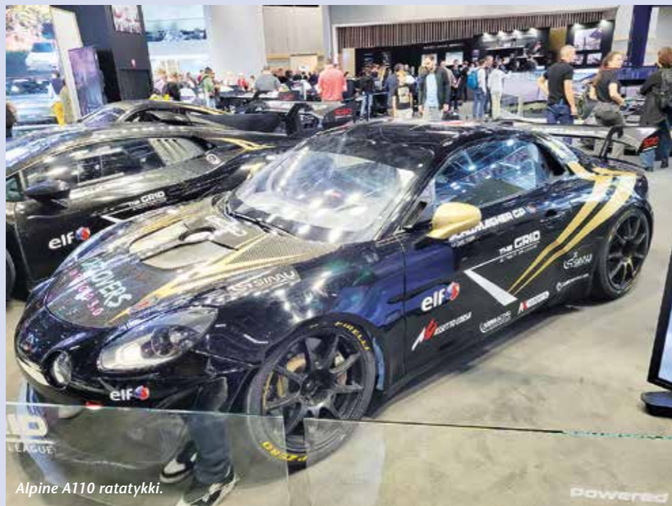
Alpine A110 ratatykki.