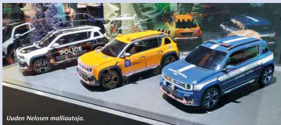
Uuden Nelosen malliautoja.