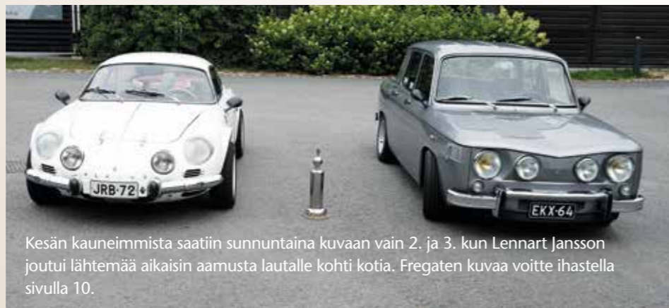
Kesän kauneimmista saatiin sunnuntaina kuvaan vain 2. ja 3. kun Lennart Jansson joutui lähtemää aikaisin aamusta lautalle kohti kotia. Fregaten kuvaa voitte ihastella sivulla 10.