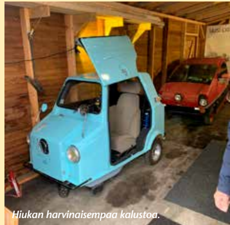
Hiukan harvinaisempaa kalustoa.