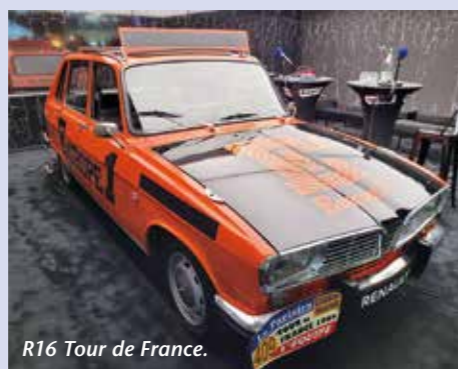
R16 Tour de France.