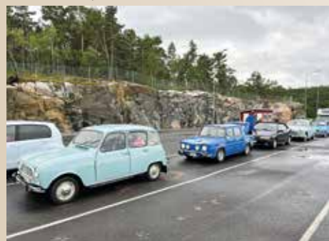
Pikkulautalle jonottamista Turun saaristossa.