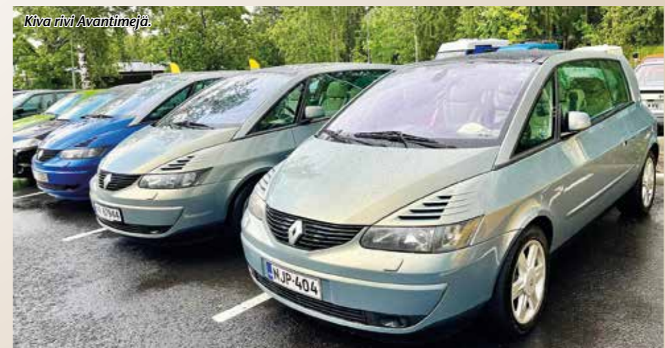
Kiva rivi Avantimejä.