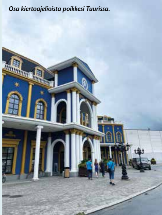
Osa kiertoaajeloista poikkesi Tuurissa.