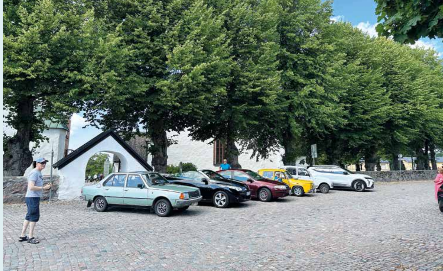
Teksti Mikael

Renault-kerhon 40-vuotisen taipaaleen kunniaksi idea kiertoajelusta tuli jo edellisen vuoden syksyllä. Kiertuepaikoiksi valikoitui aktiivisia kuukausitapaamisalueita.