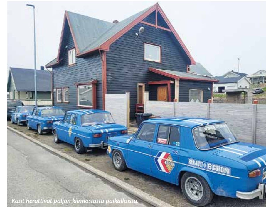
Kasit herättivät paljon kiinnostusta paikallisista.

Viimeinen reissumme yö majailimme Inarin Wil