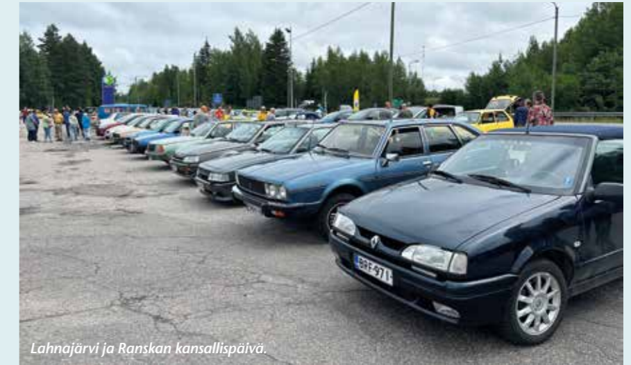
Lahnajärvi ja Ranskan kansallispäivä.