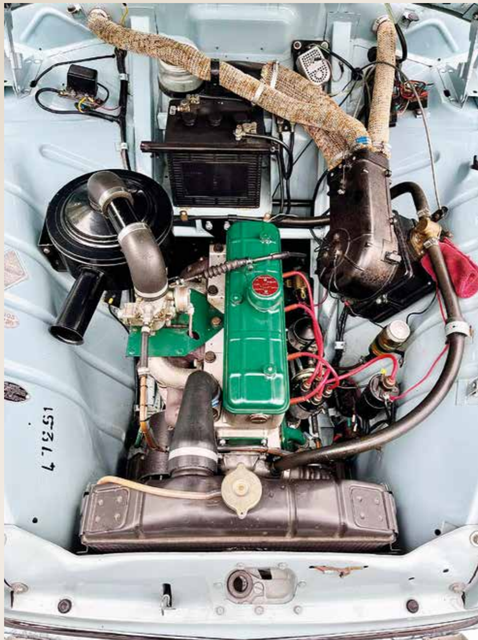
Niin siisti Fregaten konehuone.