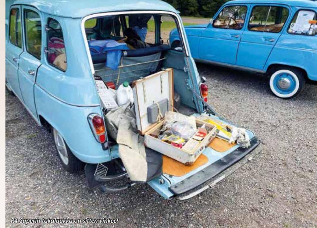
R4 Superin takaluukku on sitten vinkeä!

Sunnuntai oli lyhyt päivä ilman muita aktiviteetteja kuin pieni huutokauppa Renault-tavaroille ja palkintojenjakotilaisuus. Kävi ilmi, että suomalaiset olivat parempia tietokilpailijoita, sillä he veivät kaikki viisi palkintoa. Maaottelusta arvasimme, että suomalaiset