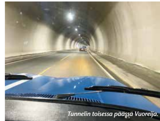
Tunnelin toisessa päässä Vuoreija.

Ajelimme kylää ristiin rastiin ja osa kävi saaren pohjoispäässä Vardön majakalla. Tie sinne oli haasteellinen hiekkapolku minkä takia osa kääntyi takaisin kylään.