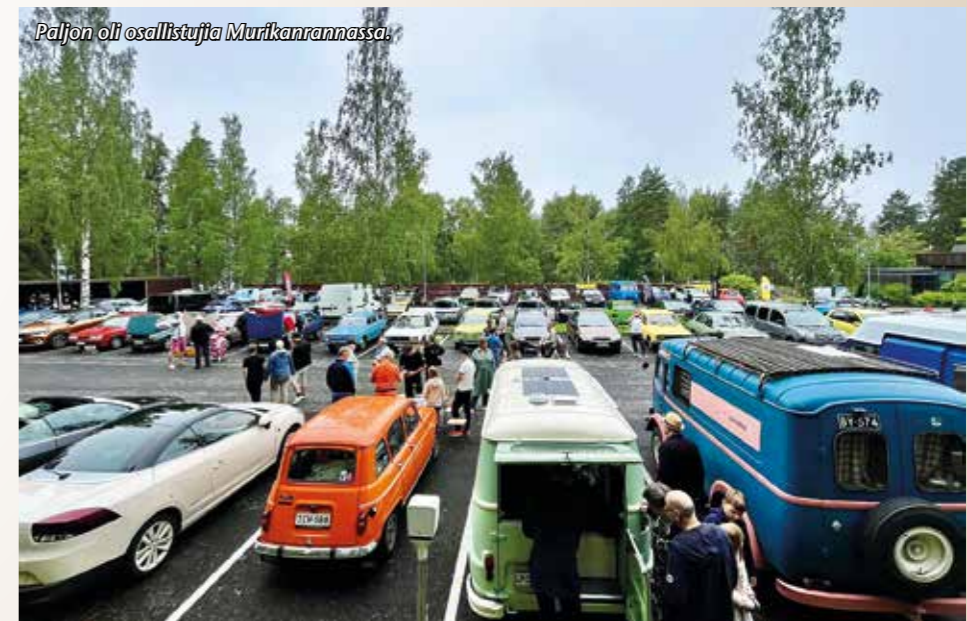
Paljon oli osallistujia Murikanrannassa.