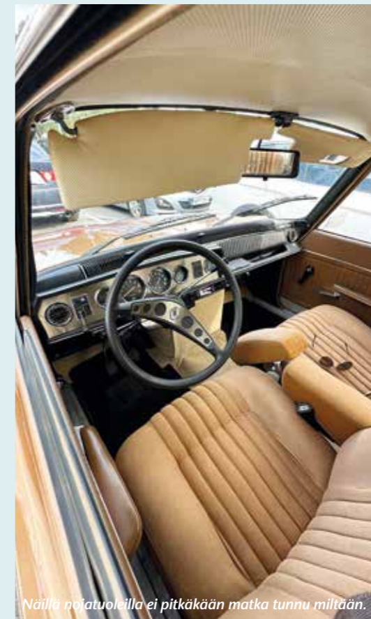
Näillä poltuoleilla ei pitkäkään matka tunnu miltään.

Lopuksi on todettava: Paljon onnea meidän 40-vuotiaalle kerhollemme!