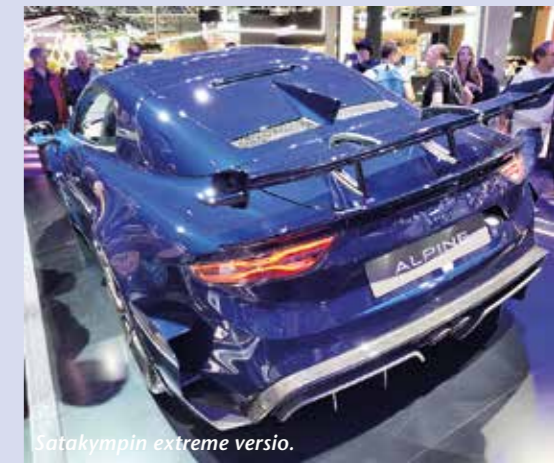
Satakymppin extreme versio.