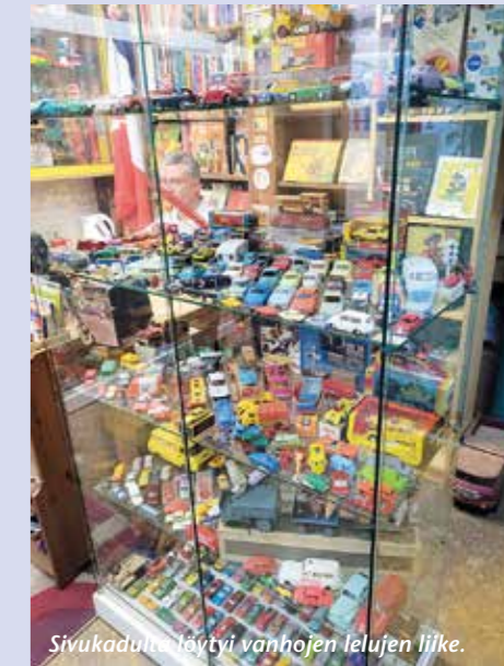
Sivukadulta löytyi vanhojen lelujen liike.