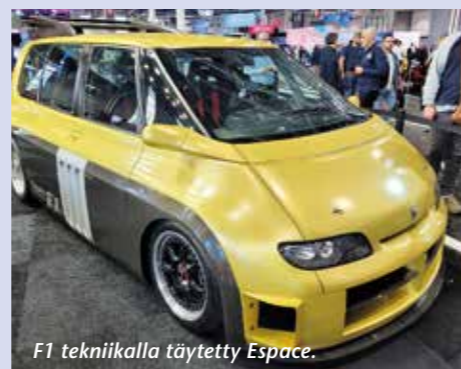
F1 tekniikalla täytetty Espace.