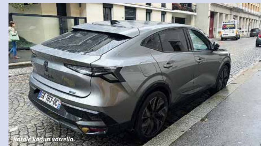
Rafale kadun varrella.