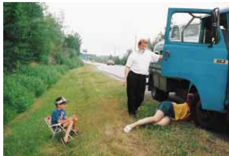
Ensimmäinen hidaste matkaan tuli Naantalin seutuvilla, kun Savikka päätti olevansa jarruhoollon tarpeessa.

Aamulautalle mahduimme mukaan, mutta edelleenkin oli jännitystä ilmassa, sil-