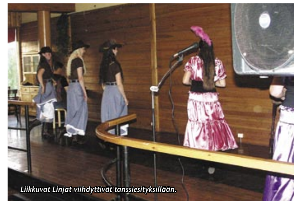
Liikkuvat Linjat viihdyttivät tanssiesityksillään.